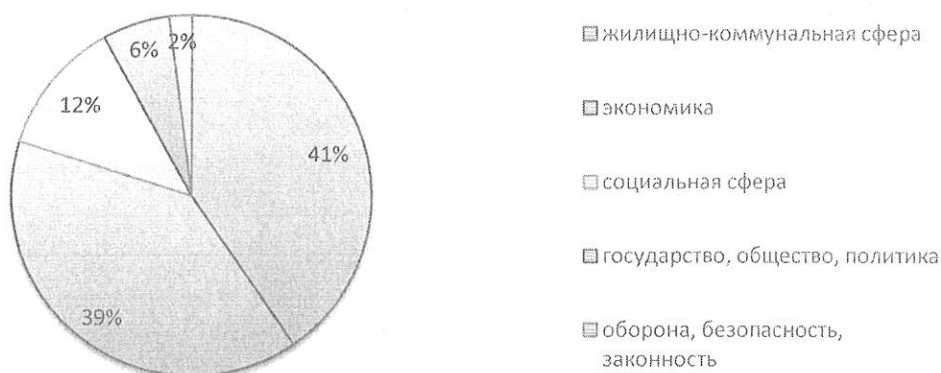
Распределение вопросов тематического классификатора по обращениям за 2025 год