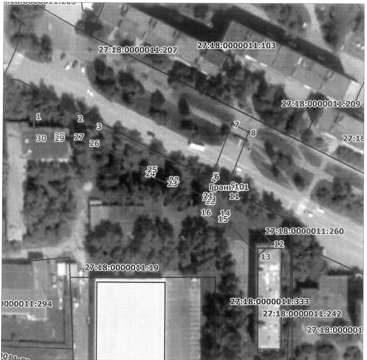
Схема расположения границ публичного сервитута на кадастровом плане (или кадастровой карте) территории