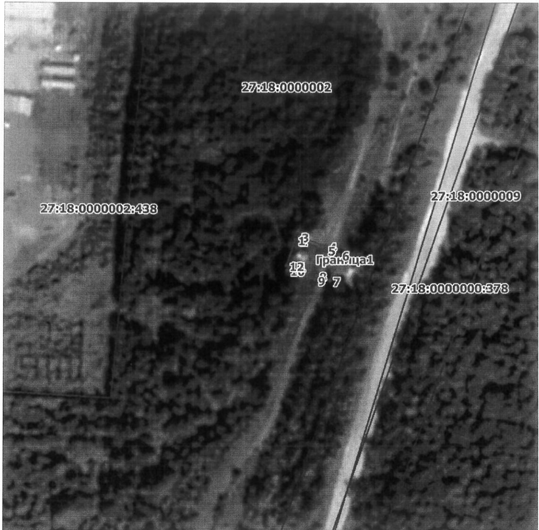
Схема расположения границ публичного сервитута на кадастровом плане (или кадастровой карте) территории