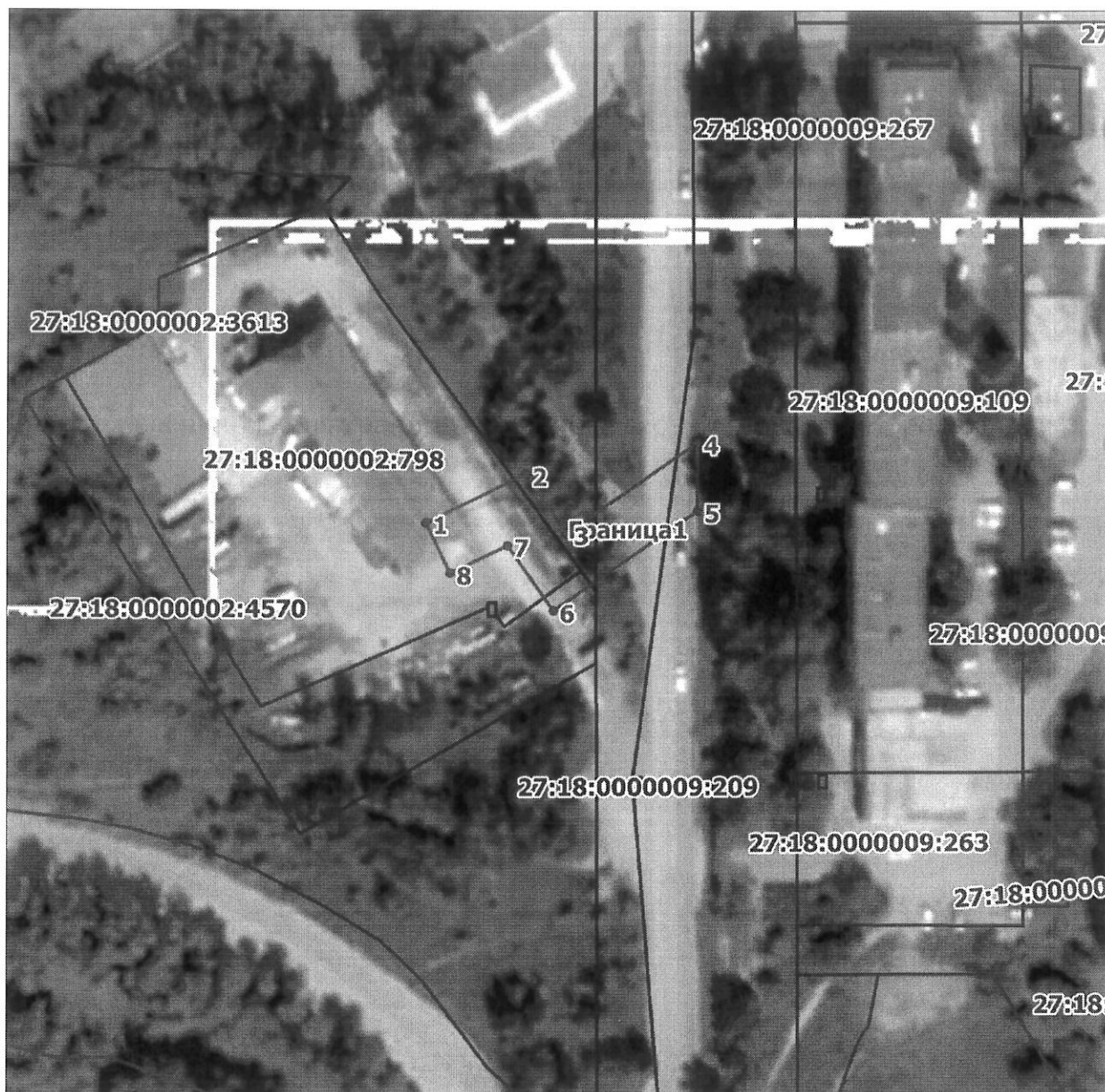
Схема расположения границ публичного сервитута на кадастровом плане (или кадастровой карте) территории