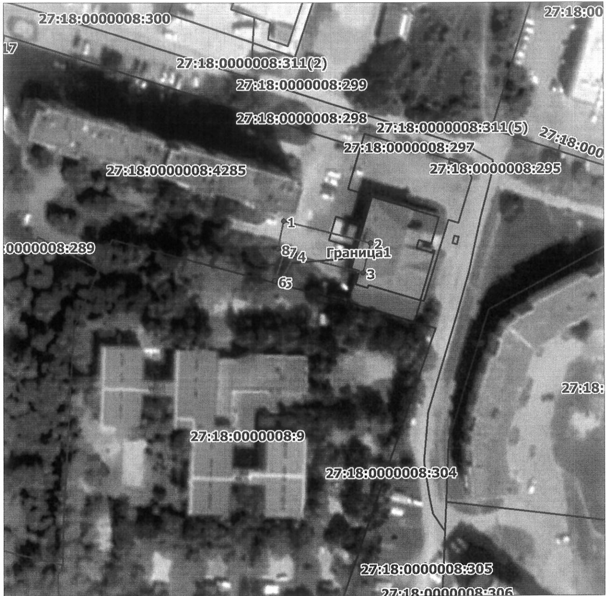
Схема расположения границ публичного сервитута на кадастровом плане (или кадастровой карте) территории