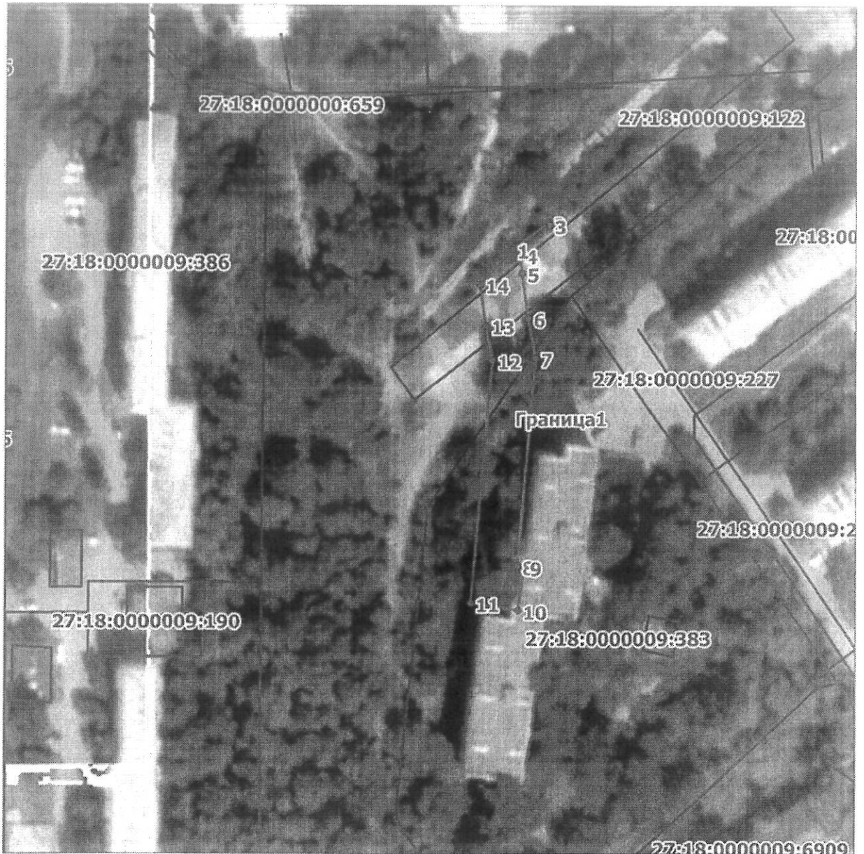
Схема расположения границ публичного сервитута на кадастровом плане (или кадастровой карте) территории