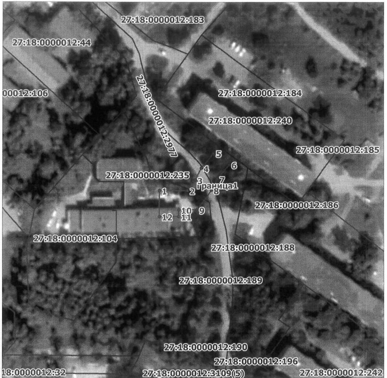
Схема расположения границ публичного сервитута на кадастровом плане (или кадастровой карте) территории