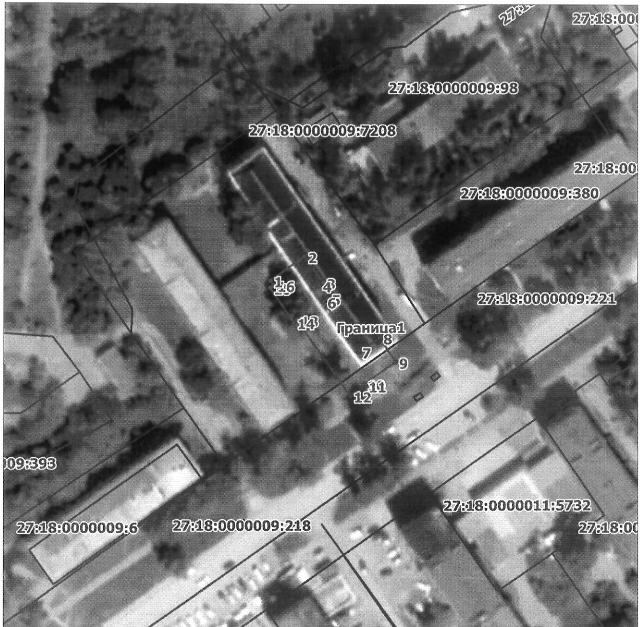
Схема расположения границ публичного сервитута на кадастровом плане (или кадастровой карте) территории