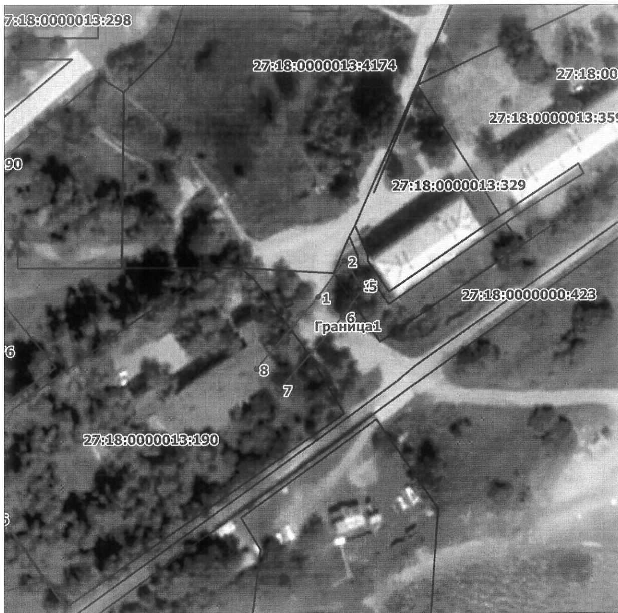
Схема расположения границ публичного сервитута на кадастровом плане (или кадастровой карте) территории