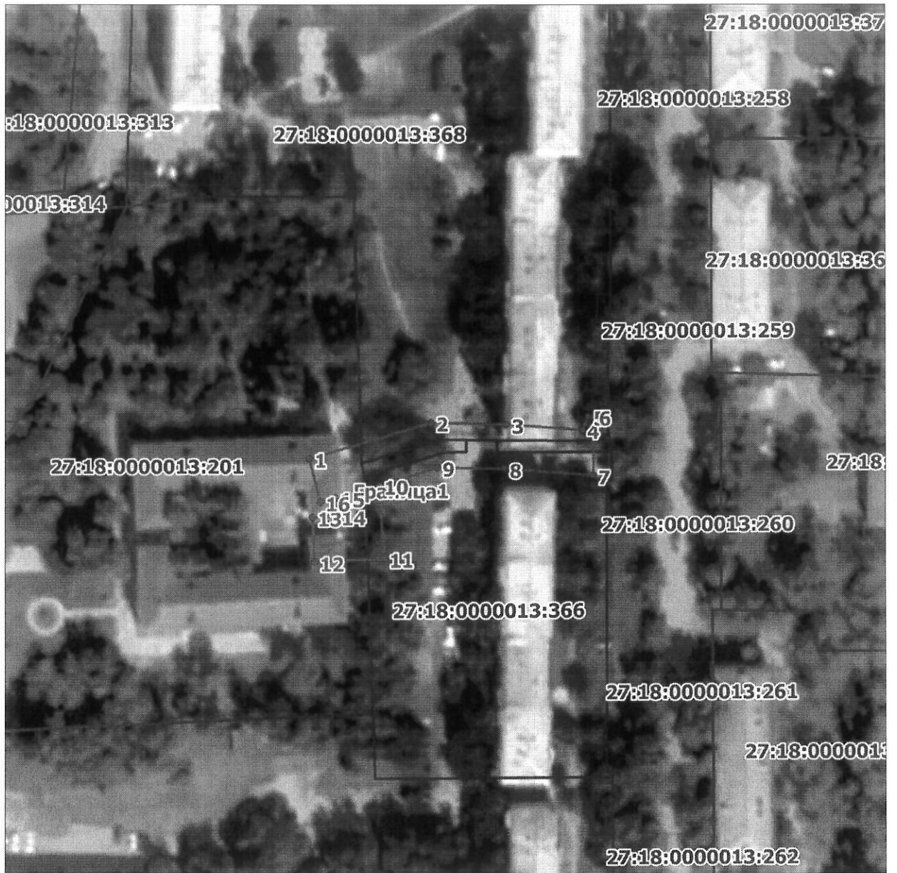
Схема расположения границ публичного сервитута на кадастровом плане (или кадастровой карте) территории