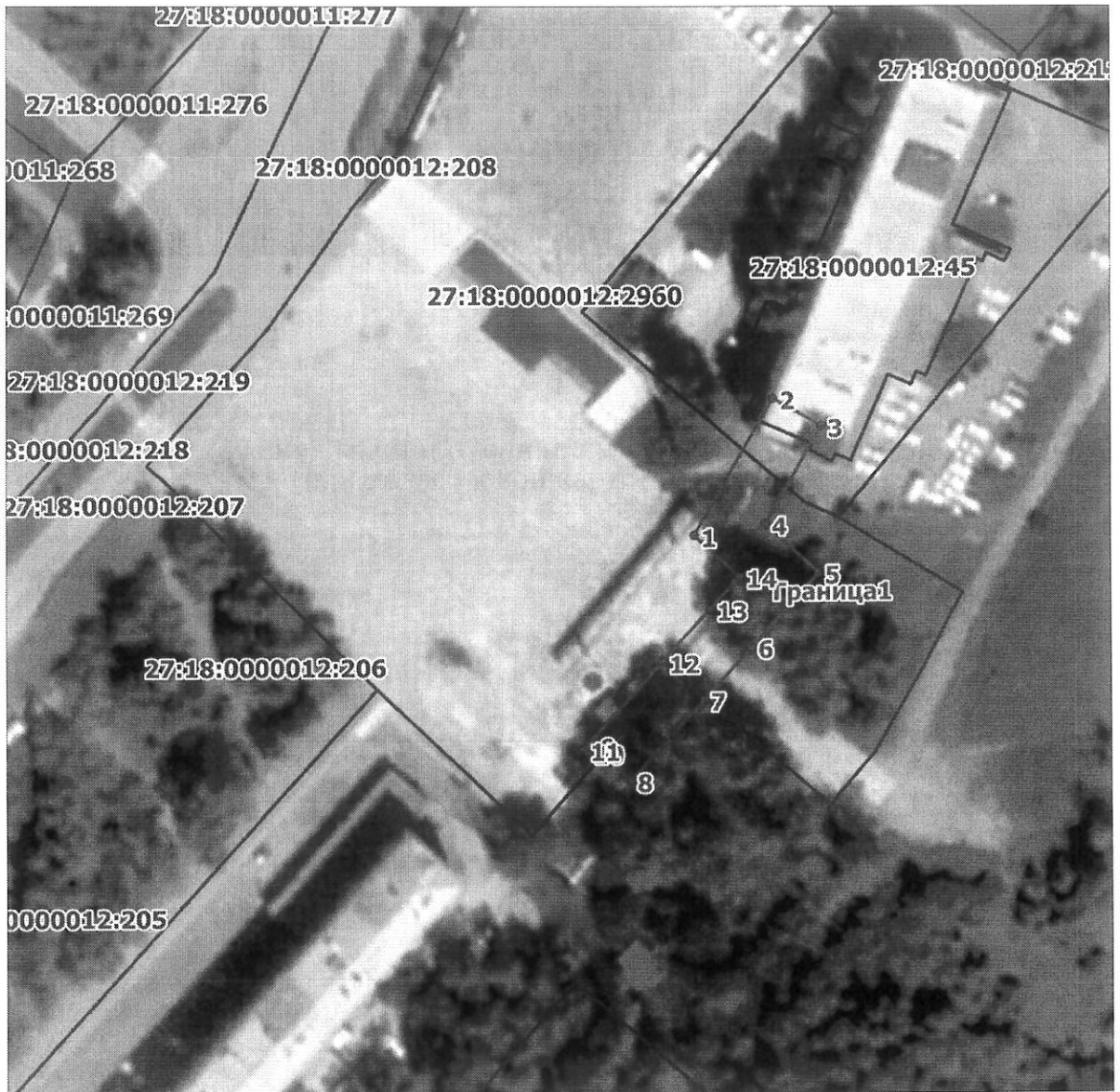
Схема расположения границ публичного сервитута на кадастровом плане (или кадастровой карте) территории