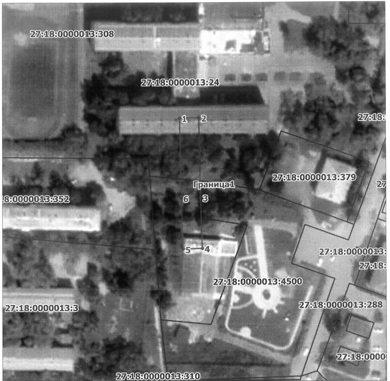
Схема расположения границ публичного сервитута на кадастровом плане (или кадастровой карте) территории