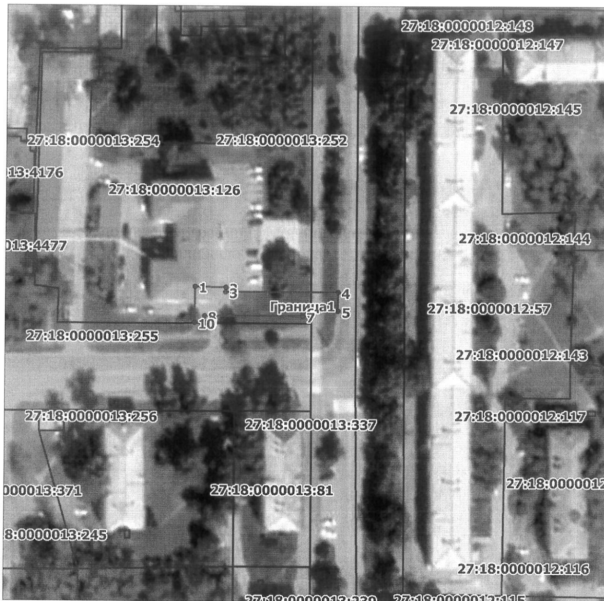
Схема расположения границ публичного сервитута на кадастровом плане (или кадастровой карте) территории