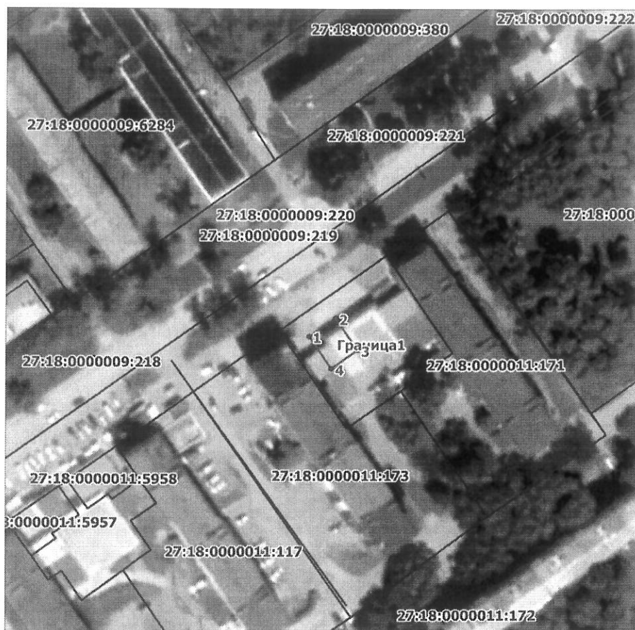
Схема расположения границ публичного сервитута на кадастровом плане (или кадастровой карте) территории