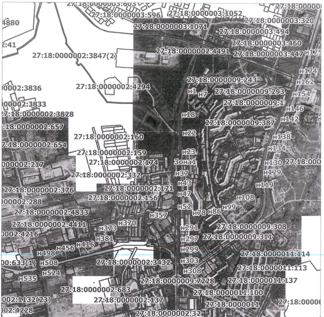
Схема расположения границ публичного сервитута на кадастровом плане (или кадастровой карте) территории